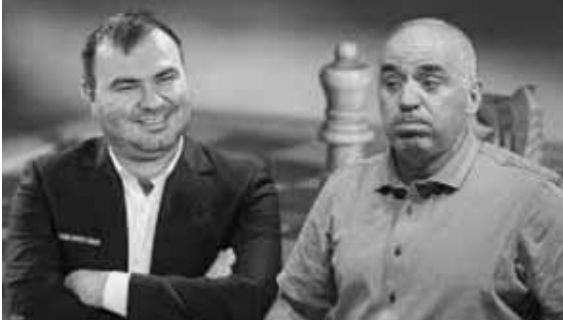
"Xaqani, sən adi piyadəsən bil, Yeddi yol keçməyin, çox asan deyil"

Bu misralar doqquz əsr öncə şahmat oyununa çox yaxşı bələd olan görkəmli Azərbaycan şairi Xaqani Şirvaninin qələmindən çıxıb. Əsərlərində şahmat fiqurlarının hərəkət və dəyərindən bir neçə dəfə istifadə edən şair bu yolun asan olmadığını ağağıdakı misralarda izah edib: